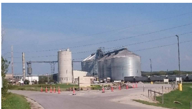
写真10 POET社のコーニング工場

エタノール生産以外に、併産物についても、コーンオイルを利用した再生アスファルトや、40～60%の粗タンパク質(CP)を含む高タンパク質製品、そして、加熱をしていない乾燥ジスチラーズグレインのダコタゴールドといった製品のラインアップを持っています。ダコタゴールドはBPX法により加熱の程度が低く、ジスチラーズグレインの乾燥にもド