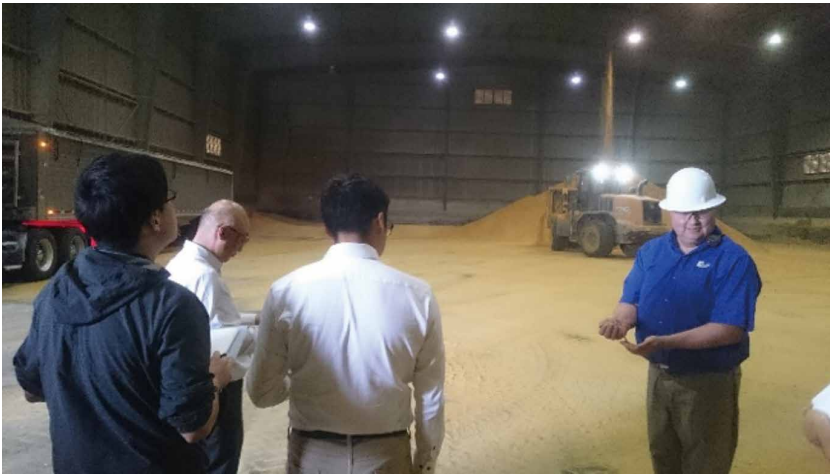
写真11 イーエナジーアダムスのエタノール工場でのDDGS保管倉庫

省とワシントン州の輸出時検査を受けるため、「ベリカン」と呼ばれる公式のサンプリング機械が16～18秒に1回コンベアを横断して、1,000トンから25ポンドのサンプルを採取し、等級付けを行うために容積重、損傷、異物と破損粒、色、出芽、カビの存在、水分含量、ストレスクラックの検査が行われます。すべての検査を行ってから実際の本船積み込みになりますが、検査結果が基準を満たさなかった場合には、積み込みは行われま