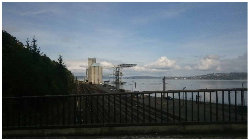
写真13 TEMCO輸出エレベーターの遠景