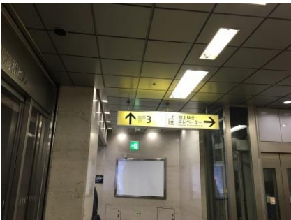
① エレベーターまたは階段で地上へ。