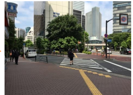
③ 横断歩道を渡らずに、コンビニエンスストアに沿って歩きます。