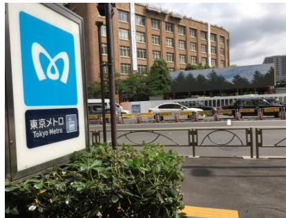
② 地上に出て、メトロの看板のある左方向に回り込みます。