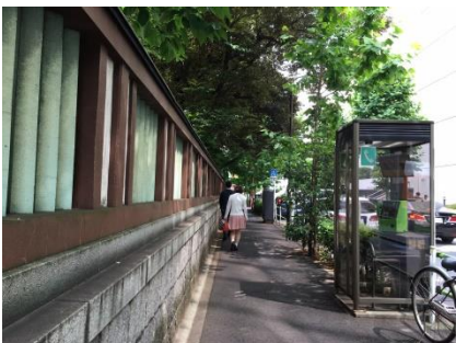
④ 金刀比羅宮の塀に沿ってまっすぐ進みます。